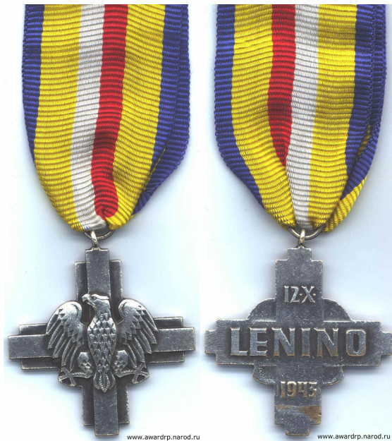
Крест «За битву под Ленино»

Вообще-то, по принятым у военных критериям армейские соединения численностью до армии ведут БОИ, объединения численность в армию и больше, при особом напряжении боев, имеют право называть их СРАЖЕНИЕМ, и только войска численностью в несколько фронтов могут вести БИТВУ. Но у поляков с битвами плохо, поэтому у них и дивизия в ходе двухдневного неудачного наступления не бой вела, а целую битву. Что поделает, на безрыбье и рак рыба. Во всяком случае поляки в честь такой битвы выпустили и медаль, и крест.